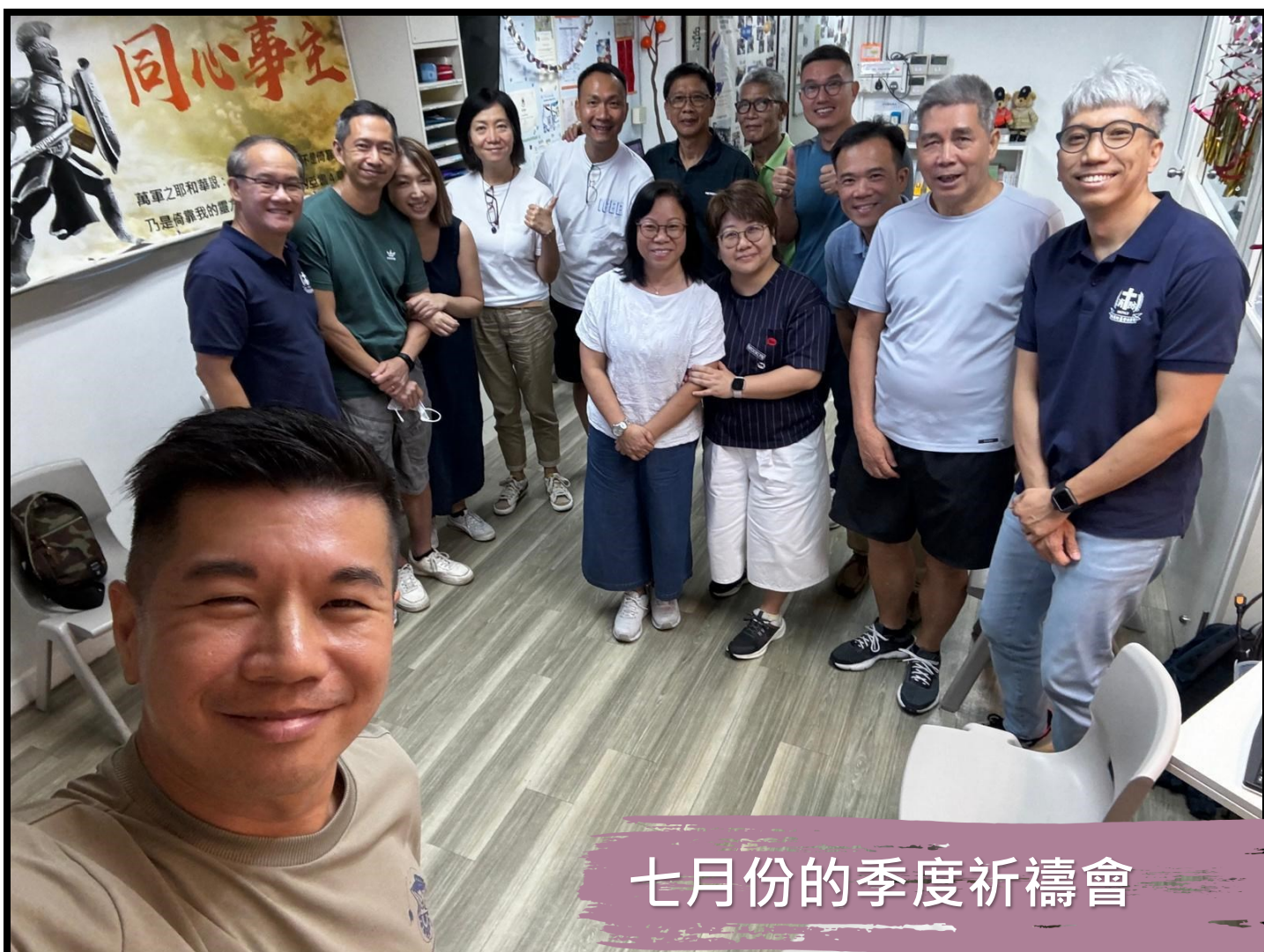
七月份的季度祈禱會