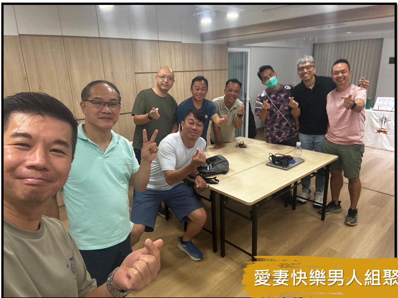
愛妻快樂男人組聚會