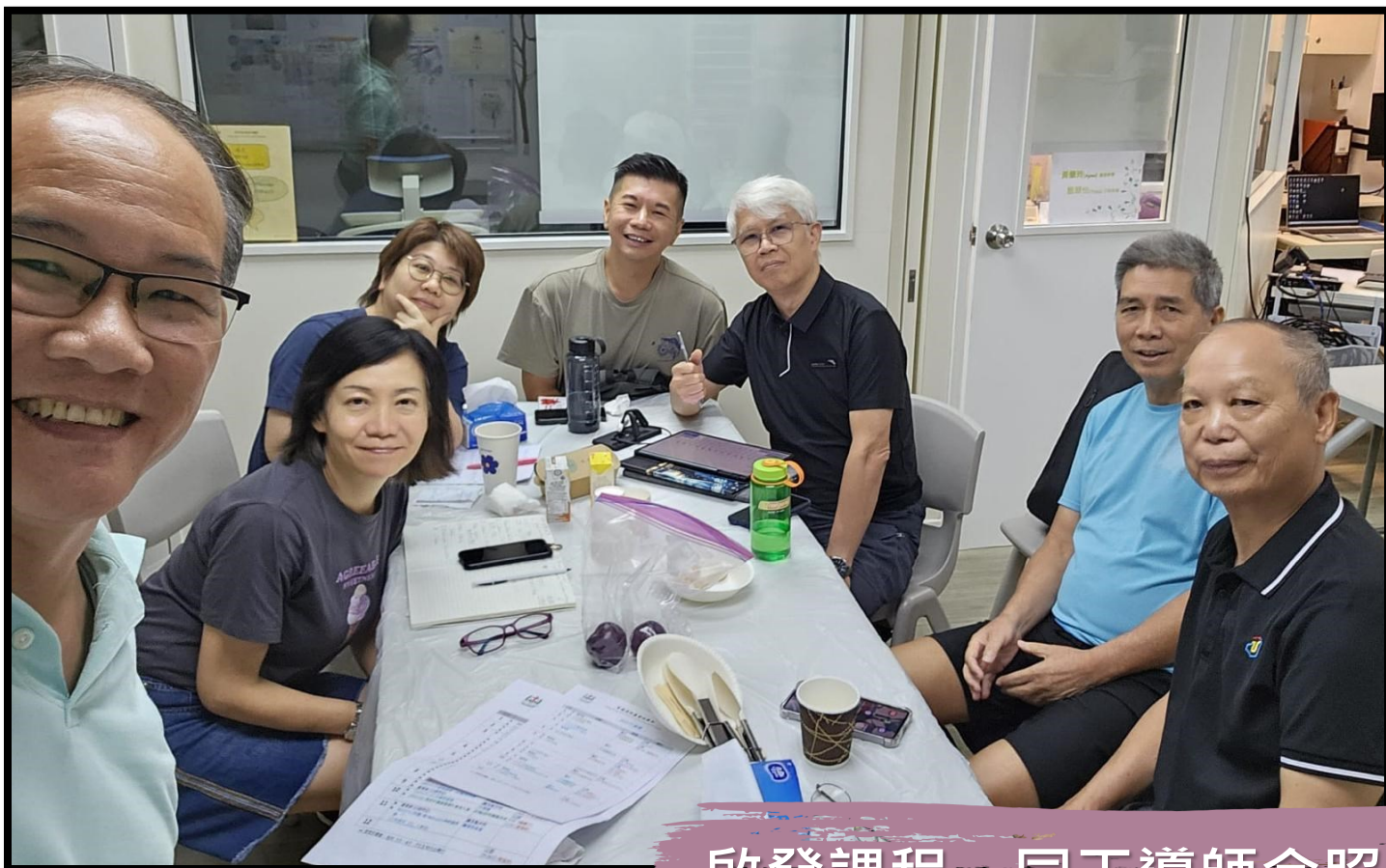
啟發課程 ~ 同工導師合照