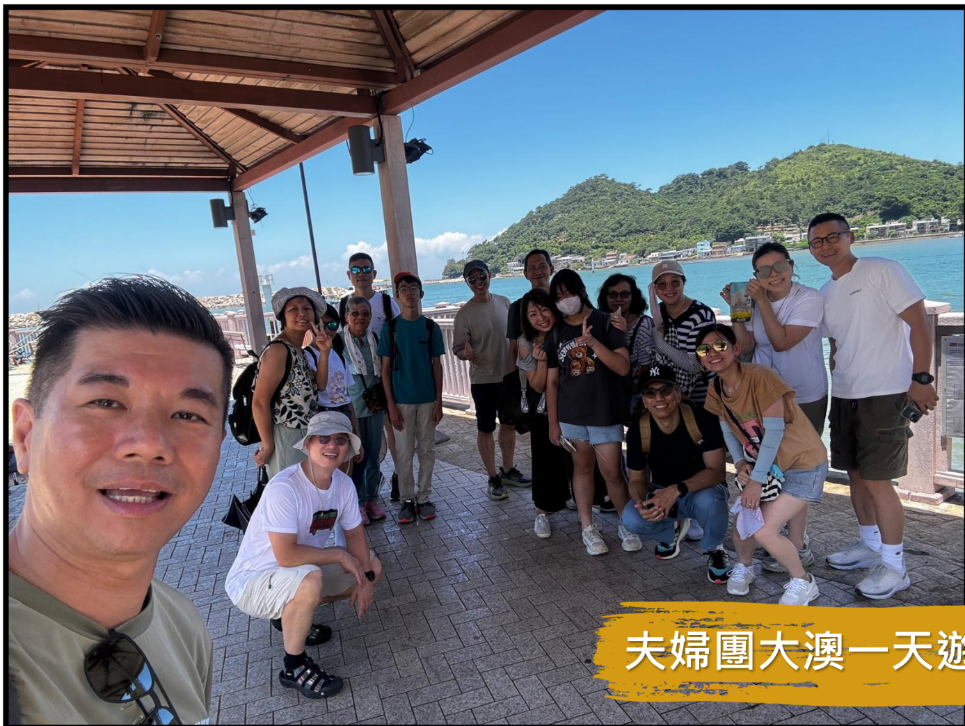
夫婦團大澳一天遊