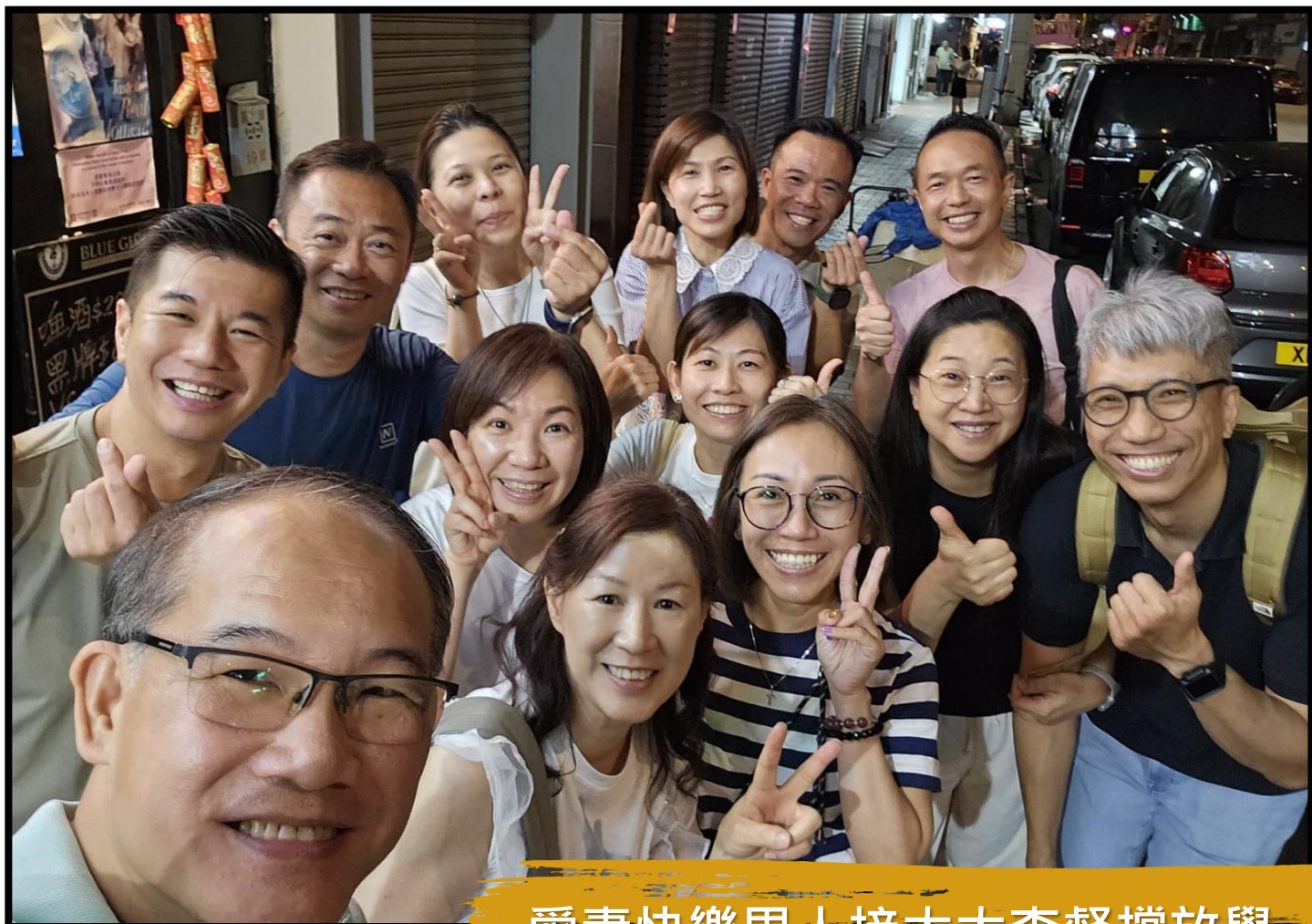
愛妻快樂男人接太太查督撐放學